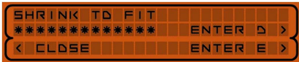
ABBILDUNG 1: Das in Farbe und Größe anpassbare Interface von shrink to fit, 2001/02

Anders als die zeitlich befristeten Tochterprojekte wird die Mutterplattform Xcult mit geringem materiellem Aufwand und ohne Drittmittel betrieben. Der Raumanpruch beschränkt sich auf einen Laptop und den Server, die Kuratorenarbeit ist unbezahlt, dem Publikum werden keine langfristigen Versprechen gemacht. Unsere Aufgabe sehen wir primär darin, den beteiligten KünstlerInnen und AutorInnen ein produktives Umfeld zu schaffen. Viele frühe Künstlerplattformen im Web sind verschwunden. Sie sind erst groß geworden und konnten dann ihr eigenes Programm nicht mehr erfüllen, sie plagen sich mit Provider-Arbeit oder schicken Bittbriefe. Unsere Haltung dazu enthält eine Spur Trotz: Wachsen, schrumpfen, temporäre Auswüchse treiben und die Aktivität danach wieder auf low-budget Niveau absenken, so umschreibt sich seit neun Jahren unsere Überlebensstrategie. Schließlich lockt uns die Arbeit im Web, weil die Produktions- und die Distributionsmittel privat bezahlbar sind, weil nicht Deadlines sondern work-in-progress Formen den Takt angeben, und weil IP-Nummern, die das Publikum in der Webstatistik repräsentieren, keine gelangweilten Gesichter schneiden können ;-).