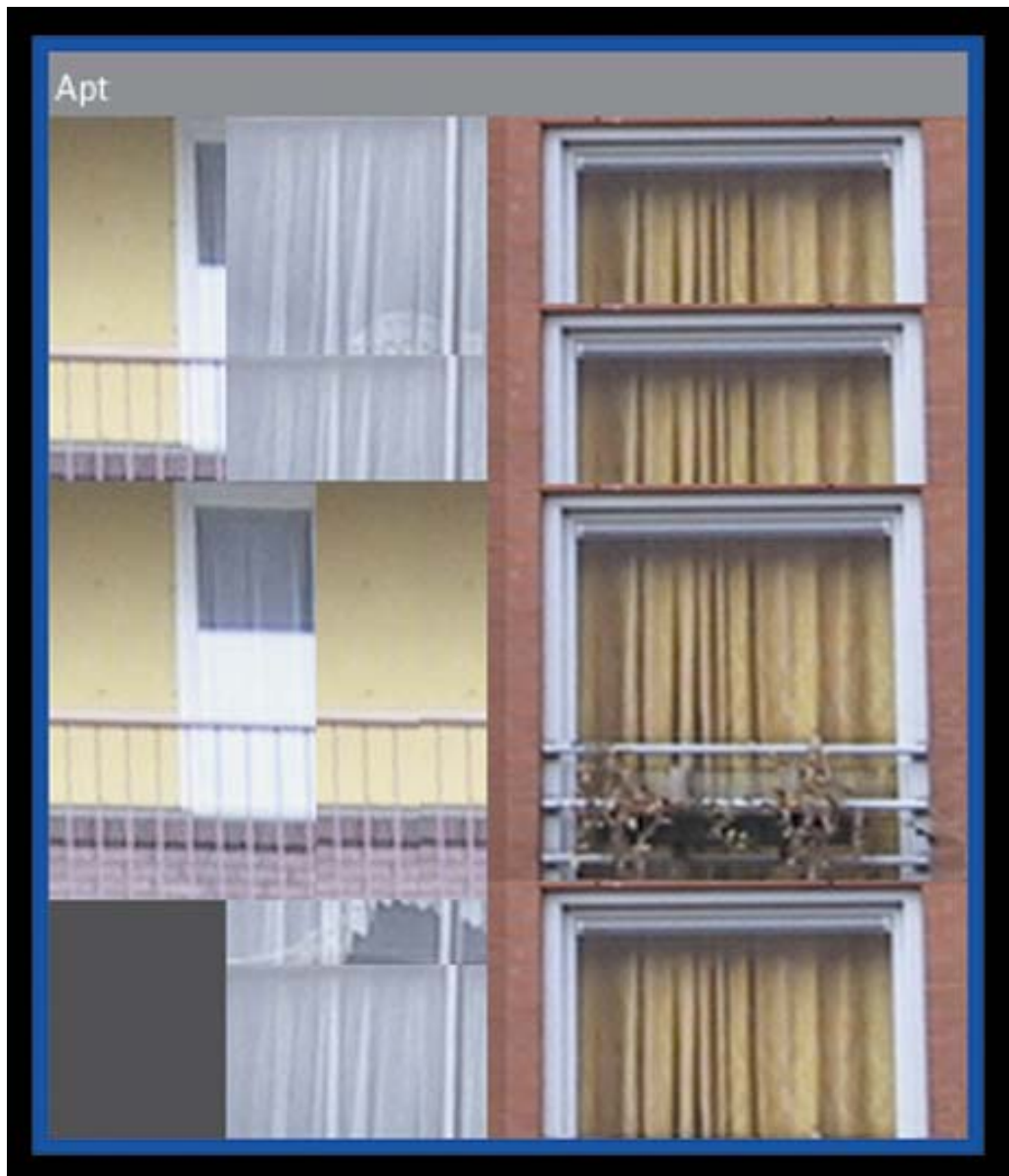
ABBILDUNG 8: Shu Lea Cheang, nomad artist: Apt, shrink to fit, 2002