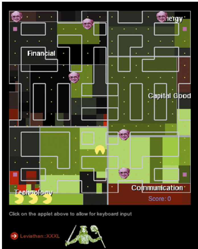
ABBILDUNG 4: Thomas Feuerstein, Wien: Leviathan, Java-Game, 2002