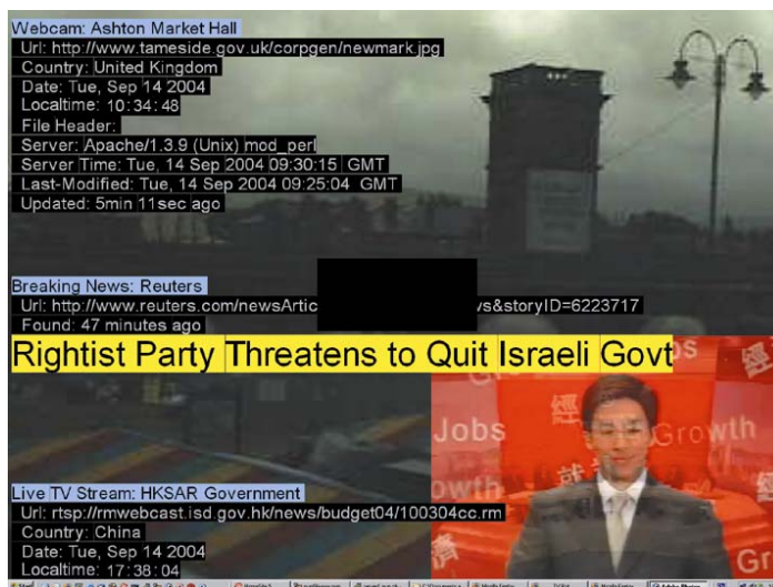
ABBILDUNG 5: Marc Lee, Zürich: TvBot, 56kTV – bastard channel, 2004/05